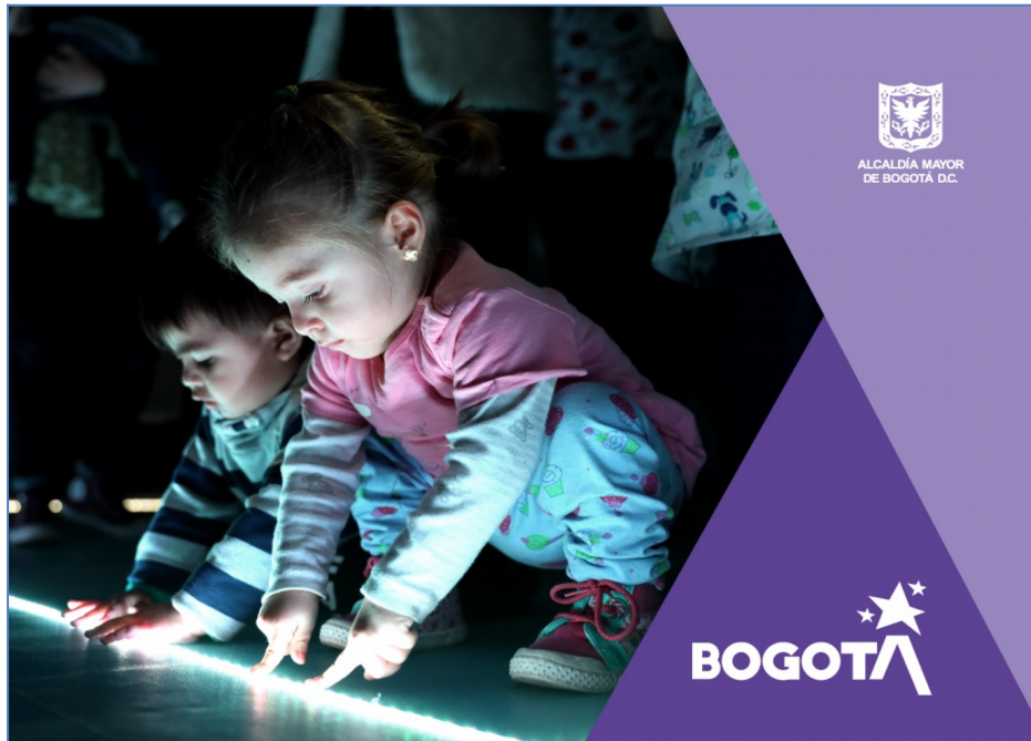
Imagen No. 1 Plantilla de ilustración power point