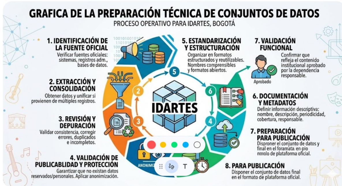
Ilustración 3. Preparación de datos. Elaboración Propia

Se privilegiará el uso de formatos abiertos y reutilizables compatibles con la naturaleza del conjunto de datos.