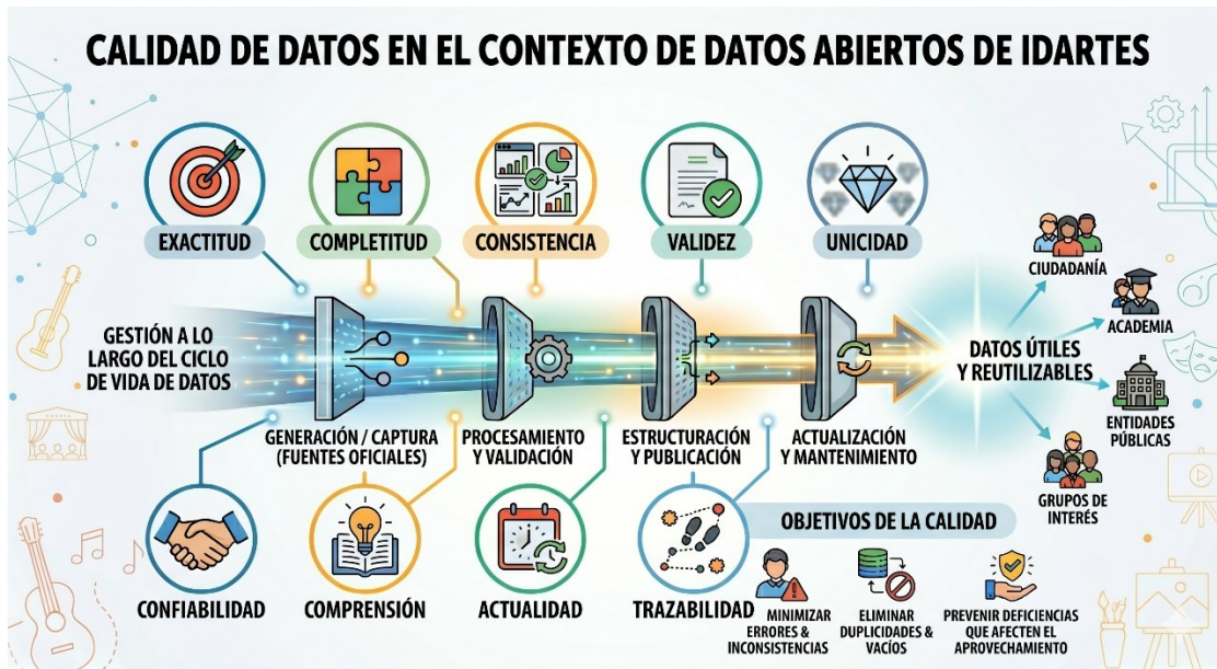
Ilustración 1. Calidad de los datos. Elaboración Propia

fuentes oficiales, pasando por su procesamiento, validación, estructuración y publicación, hasta su actualización y mantenimiento, procurando minimizar errores, inconsistencias, duplicidades, vacíos de información o deficiencias que puedan afectar su aprovechamiento o generar interpretaciones incorrectas.