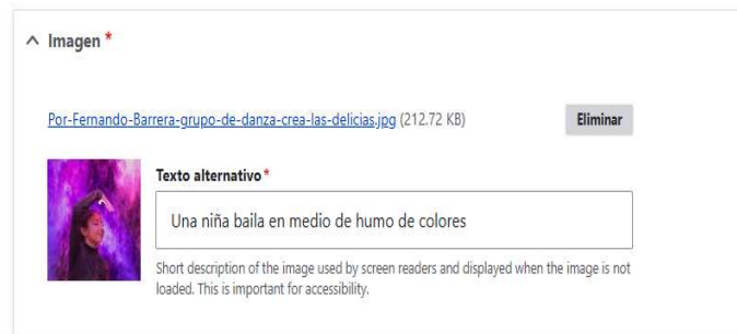
Figura 3 Noticia

Al cargar imágenes en los portales web, nos encontramos con el campo de texto alternativo, que corresponde a la descripción textual de los elementos contenidos en la fotografía para facilitar el acceso a los lectores de pantalla de personas que no puedan verla. Por ejemplo: