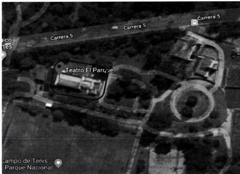
Vista Satelital ubicada de la Entidad